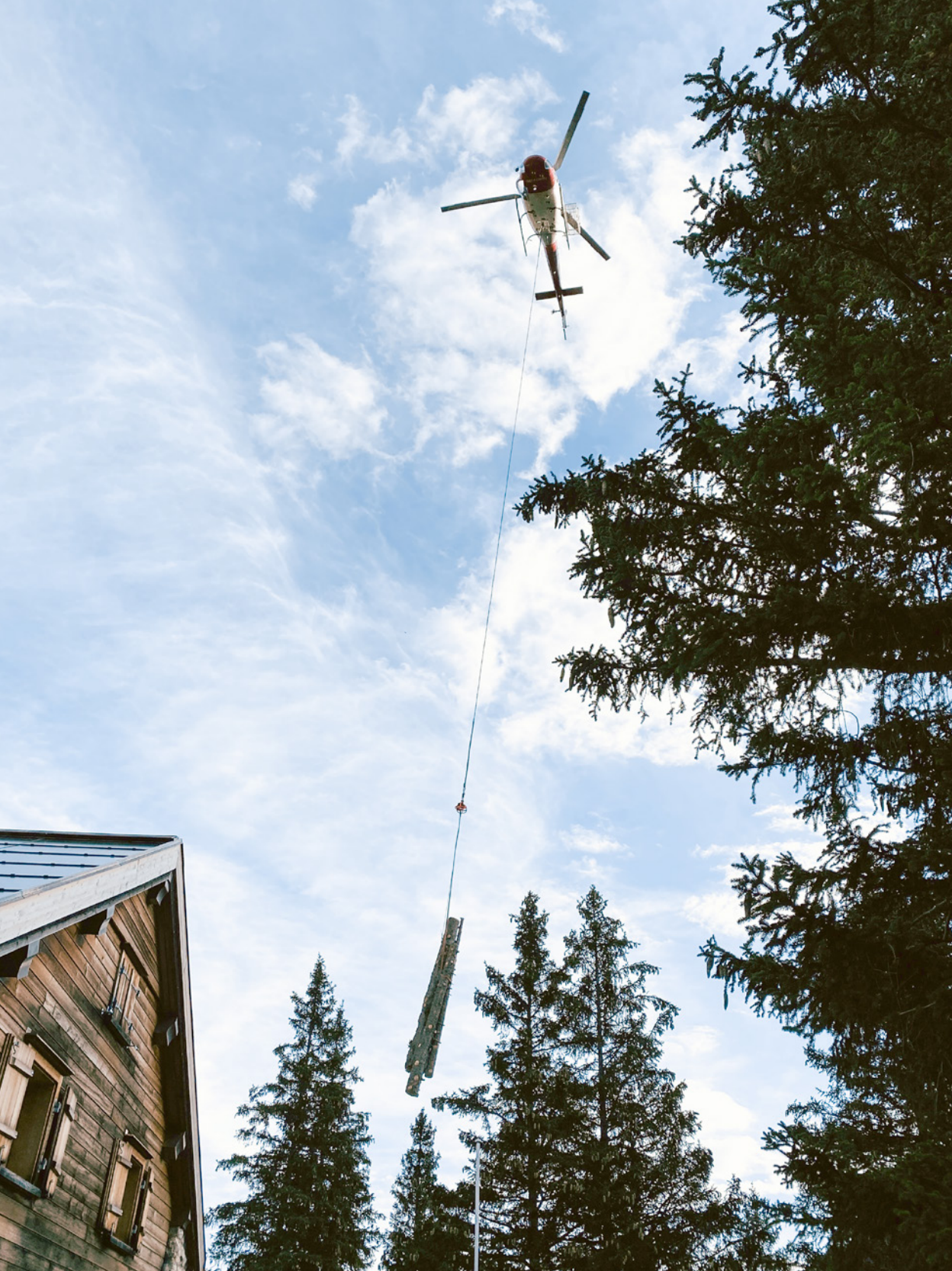
Spezialaktion Holzfällen nahe Clubheim