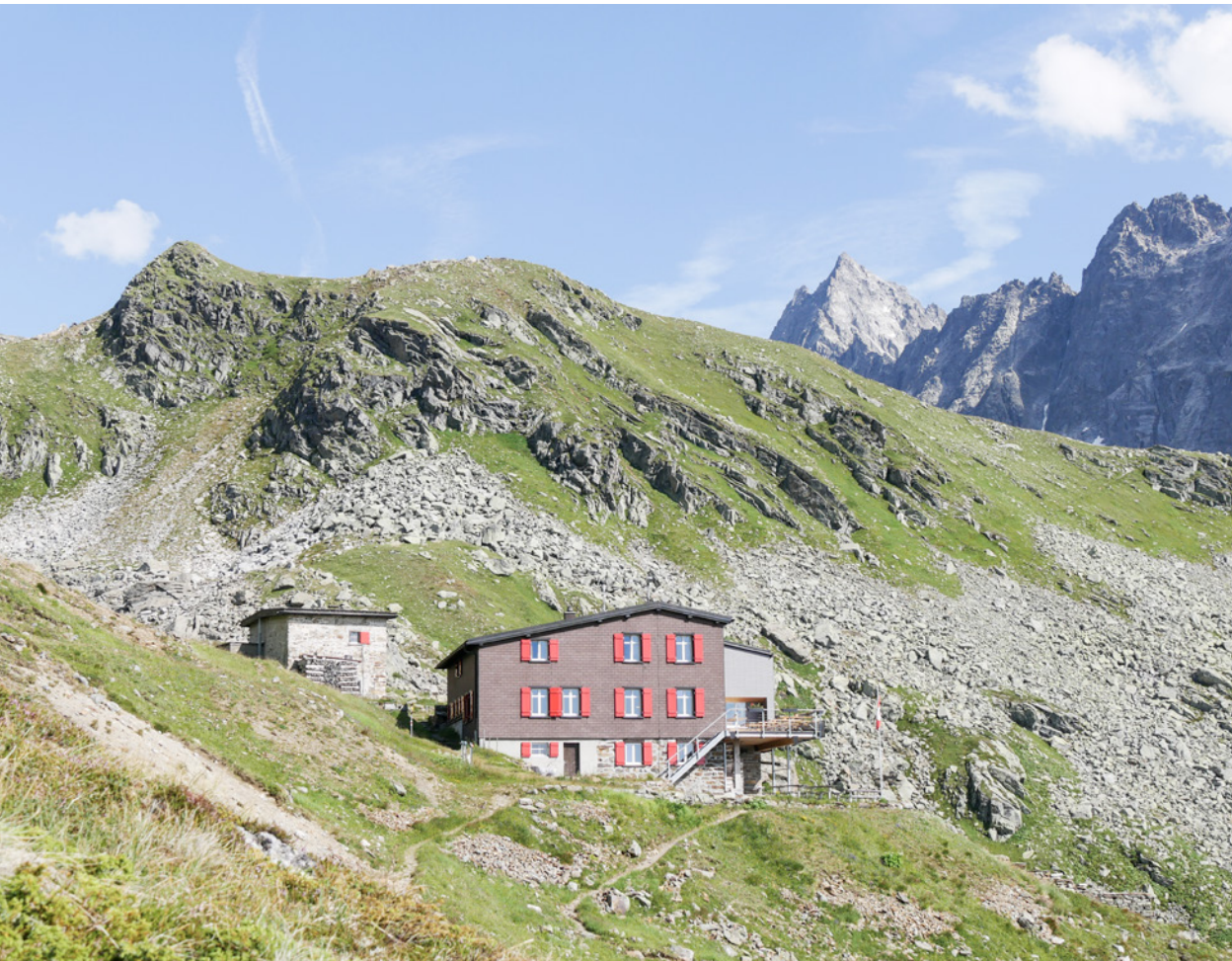
Silvretthütte auf dem Gebiet der Gemeinde Klosters.