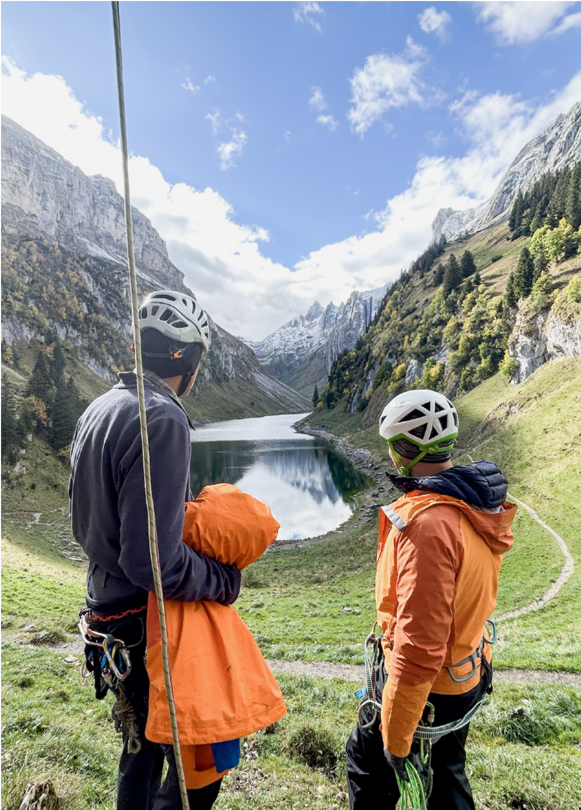
Blick auf den Fälensee während Seiltechnikkurs rund ums Clubheim.