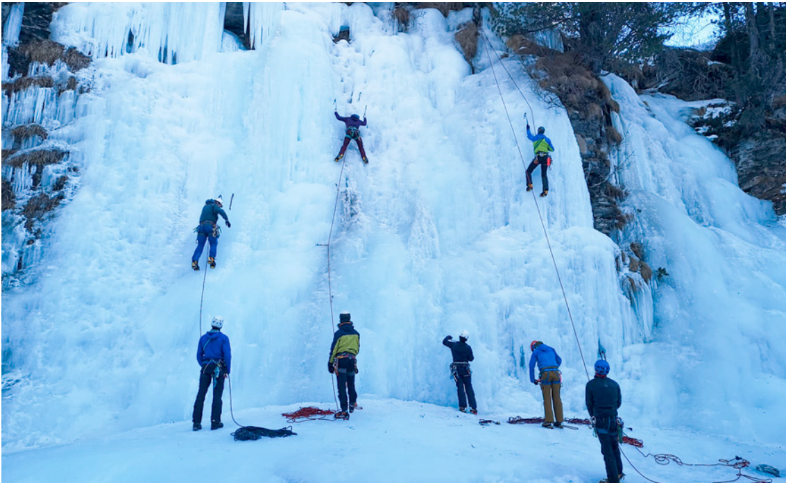
Impression vom Eiskletterwochenende.