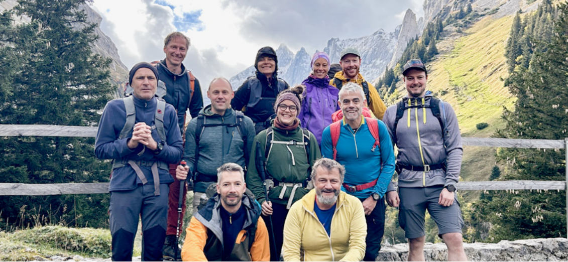
Teilnehmende und Leitung Seiltechnikkurs beim Clubheim.

Skitourenwoche im Ortlergebiet konnte durchgeführt werden.