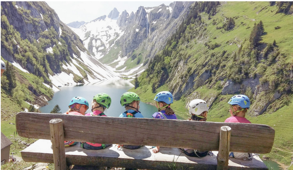
Bild: Pfingstlager 2023