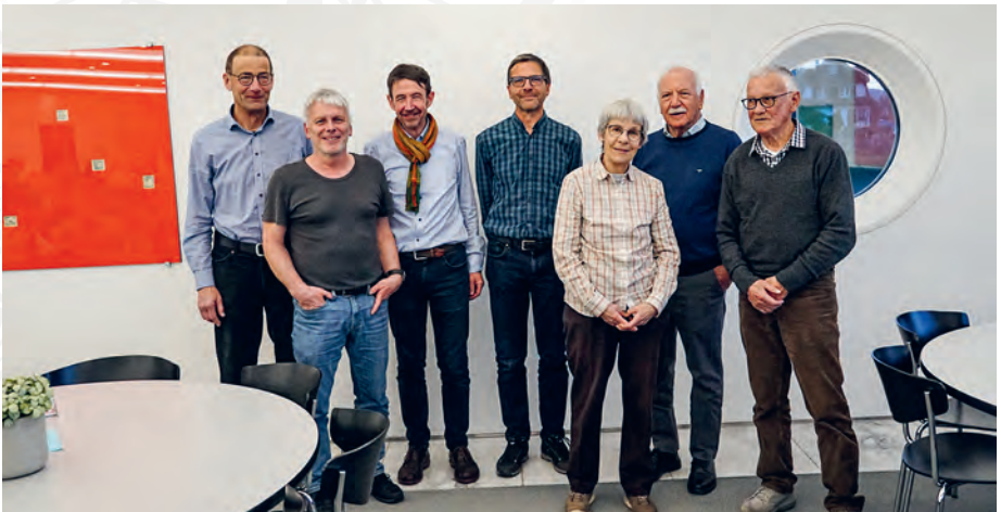
40 Jahre Clubmitglied