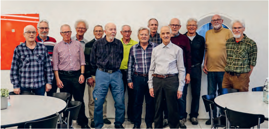
50 Jahr Clubmitglied