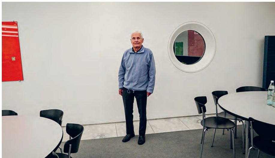
70 Jahr Clubmitglied