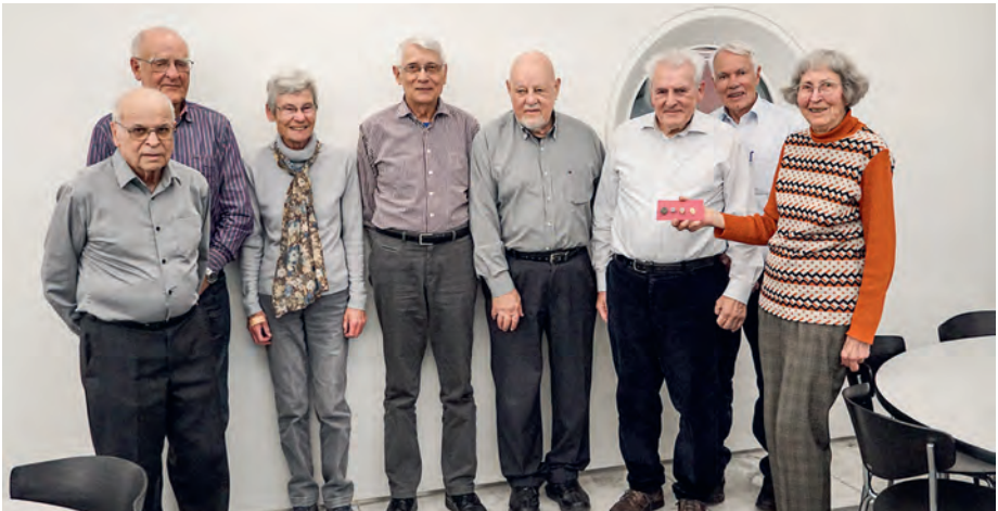
60 Jahr Clubmitglied