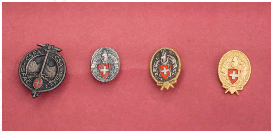
Von links nach rechts: Schweizer Frauen-Alpen-Club, Mitgliedschaftsabzeichen, Veteranenabzeichen mit Goldrand für 25 Jahre, goldenes Abzeichen für 40 Jahre