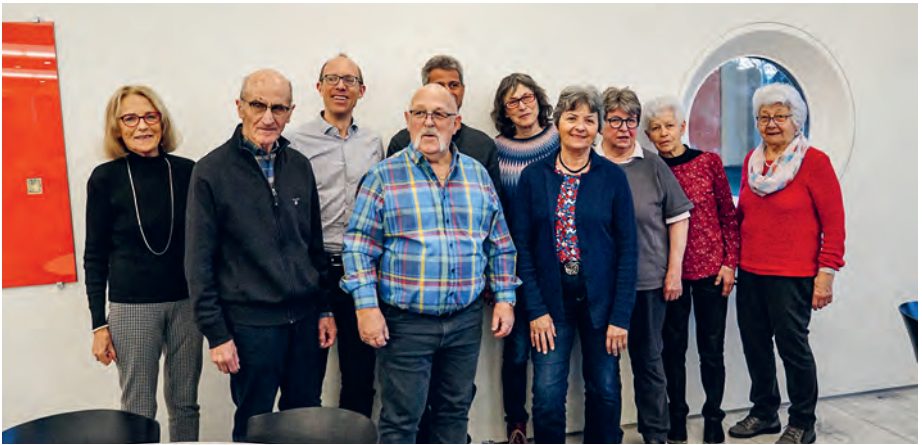
25 Jahre Clubmitglied

Apéro Gelegenheit, mit Kameradinnen und Kameraden, die man lange nicht mehr gesehen hatte, lebhaft Erinnerungen aufzufrischen. Ab 18 Uhr wurde das Abendessen serviert, zwischen den Gängen die verschiedenen Jahrgänge geehrt. 66 Club-